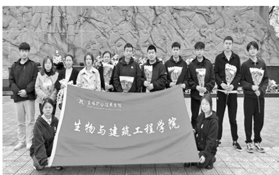
生物与建筑工程学院开展清明祭英烈活动