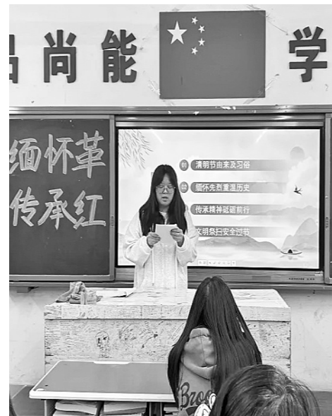
中医学院开展“缅怀革命先烈 传承红色基因”主题班会活动