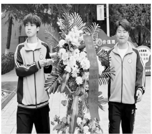
财经商贸学院学工党支部开展“缅怀英雄先烈,传承红色精神”主题党日活动的

清明时节,翠柏凝春。为进一步深化红色教育,重温红色历史,缅怀革命先烈,厚植广大师生的爱国主义情怀,近日,学院师生开展了清明祭英烈主题活动。