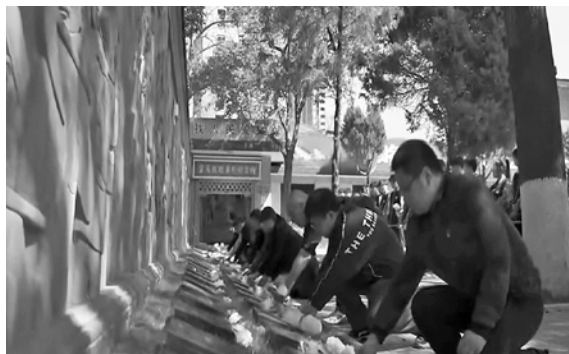
机电信息学院学工党支部赴宝天铁路英烈纪念馆开展主题党日活动的