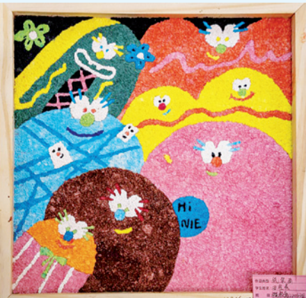
纸浆画《合家欢》 学前教育专业学生 田家燕