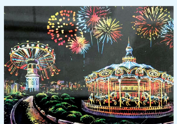
刮蜡画《嘉年华》 学前教育专业学生 杨思雨