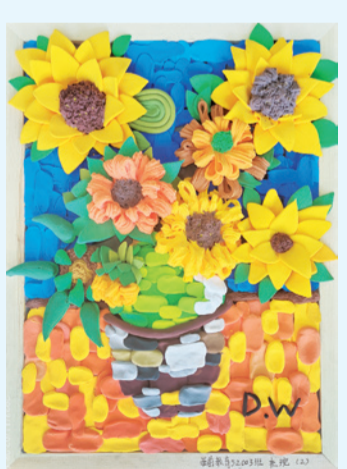
彩泥作品《向日葵》 学前教育专业学生 杜婉