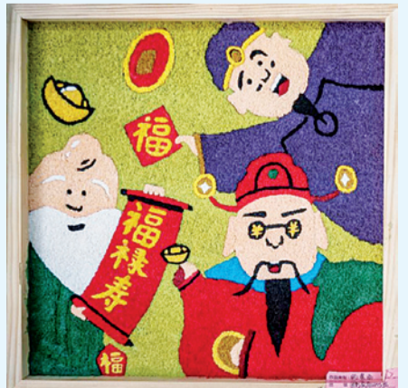
纸浆画《福禄寿》 学前教育专业学生 田家燕