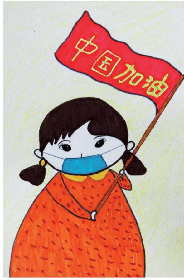
一等奖 赵欣桐 5岁