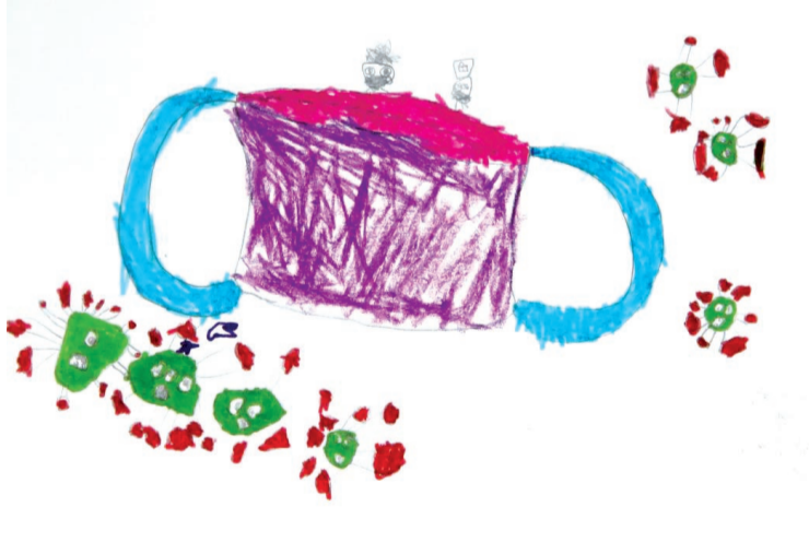
一等奖 赵好熙 5岁