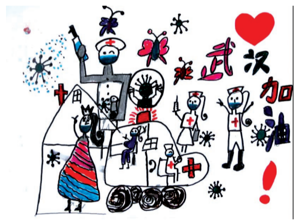
一等奖 温砚舒 6岁